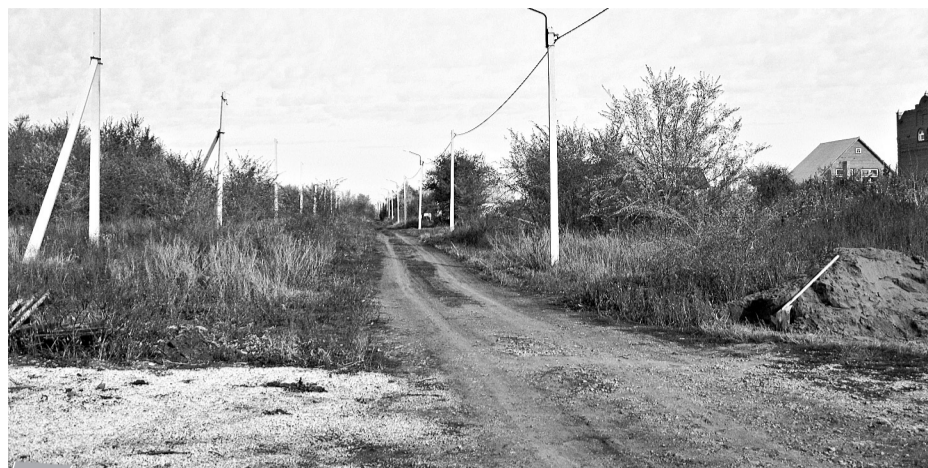
На улице Надежды много незастроенных участков. Её жители весной и осенью тонут в грязи