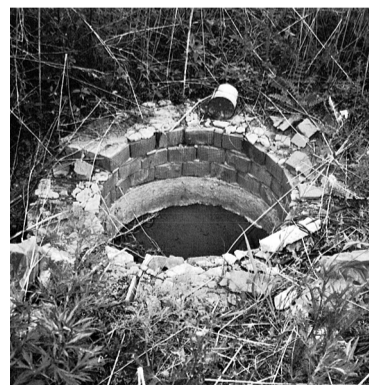
Канализационные колодцы на ул.Надежды без хозяйского присмотра приходят в негодность