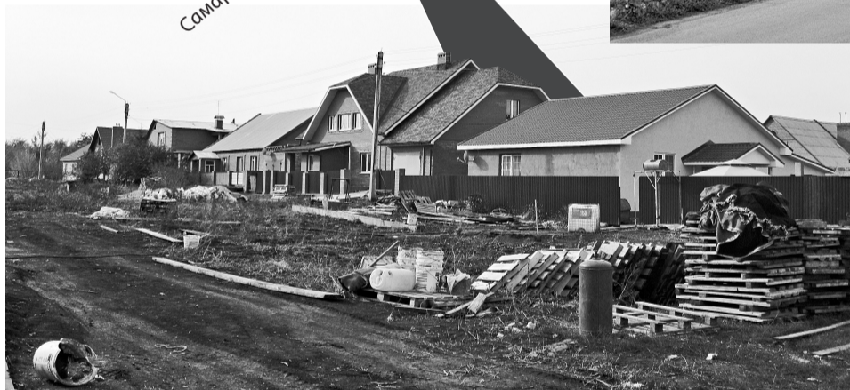
На дороге по улице Тенистая нет асфальта, нет тротуаров. Водопровод здесь не проложен. Люди обустроили колодцы и скважины, но воду пить нельзя, по своим параметрам она пригодна только для технических нужд