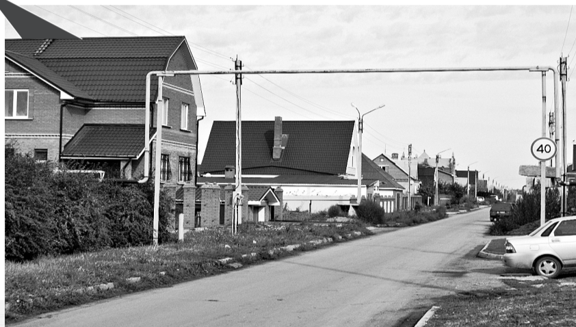
Улицы имени Рабочей Трибуны заасфальтированы. Но её жители тоже за питьевой водой ездят за несколько километров