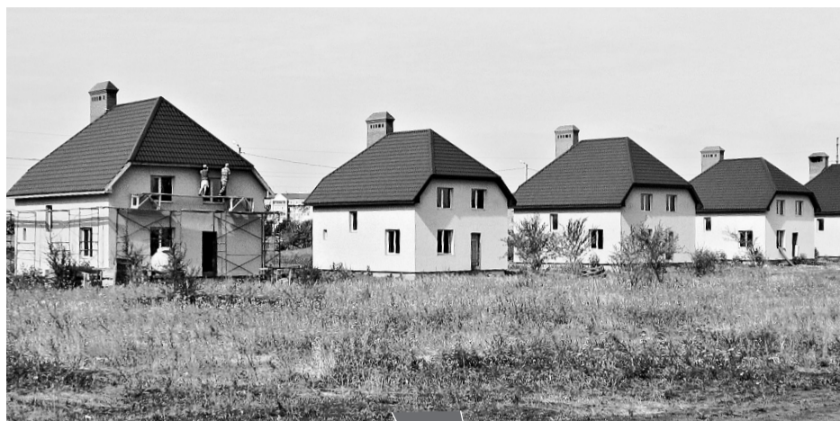
На ул.Каштановая из 44 домов всего около десяти обрели хозяев - для Отрадного коттеджи стоят дорого